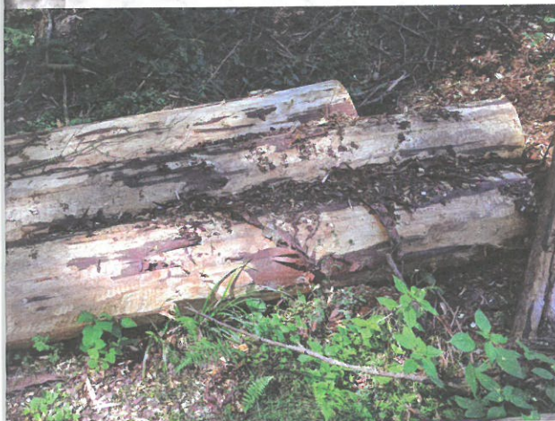
Asanace pomocí odkornění.

Ruční odkorňování je velice účinné (nelze jej ale použít ve stádiu žlutého brouka s výjimkou odkorňovacích adaptérů na motorovou pilu). Oloupání kůry z pokáceného kmene v malém množství nevyžaduje pro fyzicky zdatného vlastníka zásadní náklady, kromě investice do vlastního času a často je pro drobného vlastníka lesů jedinou dostupnou metodou. Chemická asanace nemá z hlediska vývojového stádia omezení, výkon je vyšší, ale pro drobného majitele lesa existují omezení v zajištění přípravků pro chemickou asanaci. Alternativou je odkorňování pomocí adapterů na motorovou pilu, ale je třeba vlastnit pilu s odpovídajícími parametry.