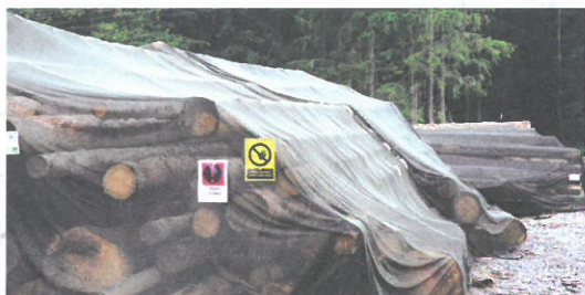
Ochrana skládek pomocí insekticidních sítí.

Asanační metoda odvozem napadeného dříví z lesa byla zavedena v 80. letech, kdy následovalo v průběhu několika dní zpracování, jehož součástí bylo většinou i odkornění. V nedávné době byla tato metoda „modifikována“ na odvoz za hranice lesa, kde lýkožrout dokončil svůj vývoj a „vrátil se“ do lesa, kde napadl další stromy. Toto je proto v současné době zakázáno. Aktivní kůrovcové dříví musí být asanováno!