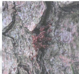
Drtinky na patě stromu.

Včasná asanace napadených stromů s využitím všech dostupných metod zabrání nebo omezí napadení dalších stromů a tím se vynaložené náklady vrátí. Je nutné brát v potaz omezení jednotlivých metod a zohlednit je pro konkrétní situaci.